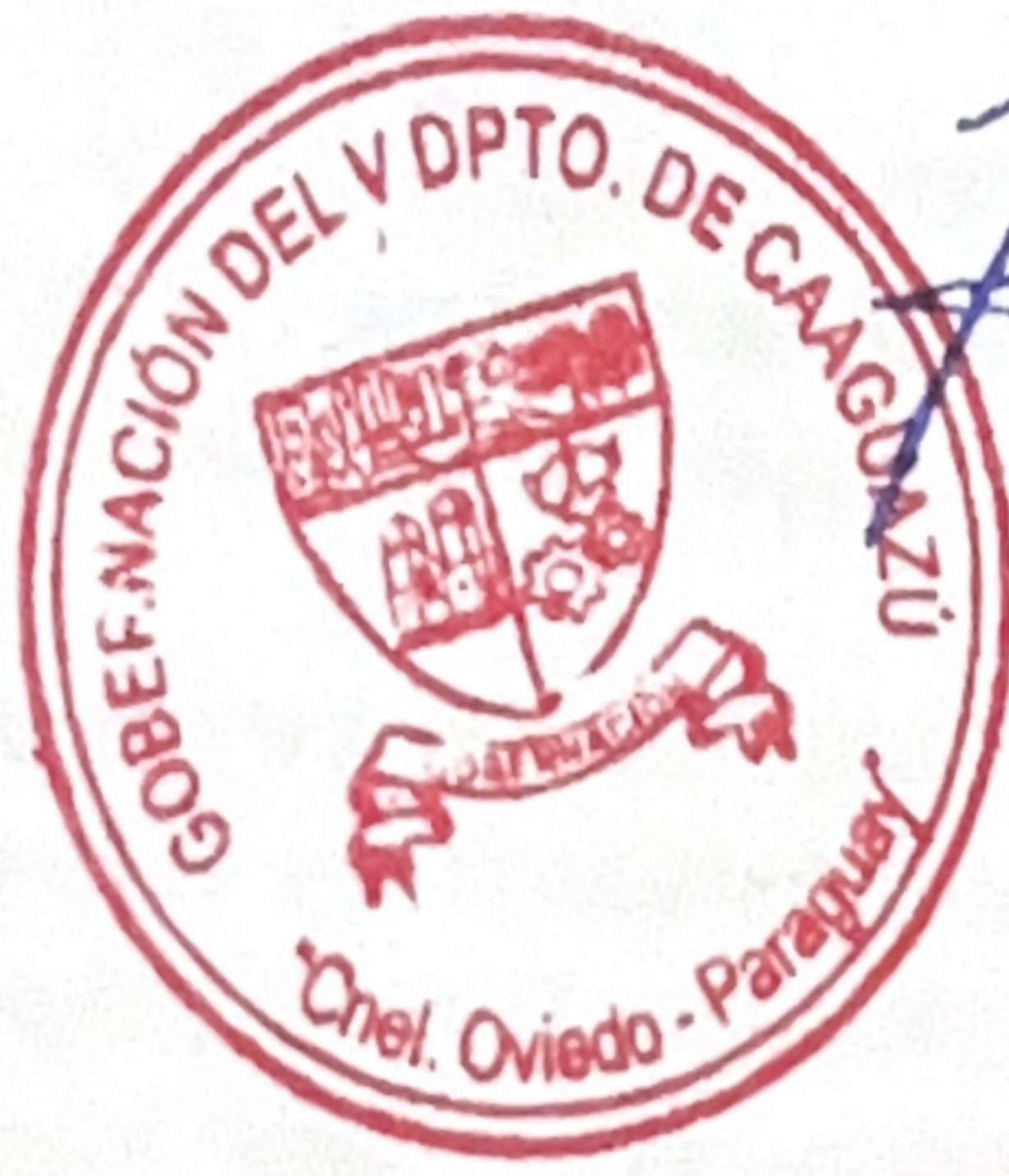
ABG. MARCELO SOTO Gobernador